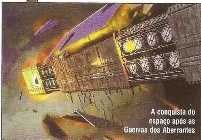
A conquista do espaço após as Guerras dos Aberrantes

Para ser um soldado Psion no mundo de Trinity, você vai precisar do Manual 3D&T, o livro básico do jogo Defensores de Tóquio 3ª Edição. O suplemento U.F.O. Team também é recomendado.